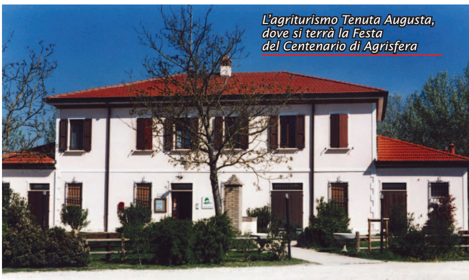
L'agriturismo Tenuta Augusta, dove si terrà la Festa del Centenario di Agrisfera

Un centenario purtroppo passato sotto silenzio, forse perché la ragione sociale non esiste più o più probabilmente perché ad Alfonsine il peso culturale della tradizione bracciantile è svanito a tal punto che nessuno si è ricordato di questo anniversario. La stessa storica sede di via Mameli sarà presto trasformata in appartamenti e rimarrà soltanto l'ufficio della locale Cgil. In quel lontano 15 gennaio, sessantacinque braccianti, tutti uomini, sottoscrissero, con il versamento di una quota a testa di dieci lire, l'atto costitutivo della cooperativa nata con l'appoggio dei socialisti "allo scopo di assumere per conto proprio lavori pubblici e privati oppure assumere in affitto o per enfiteusi terreni per la loro coltivazione".